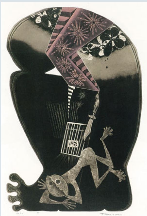
《アシェンダの地下にて》1980